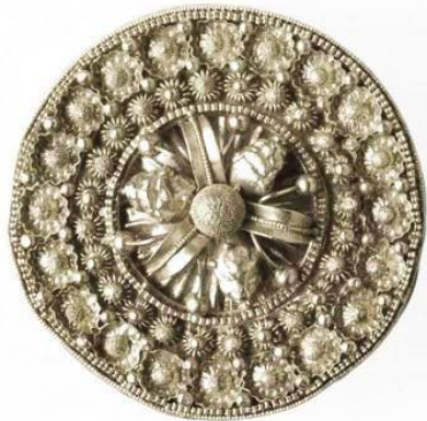
Dos Etruscos, 600 AC