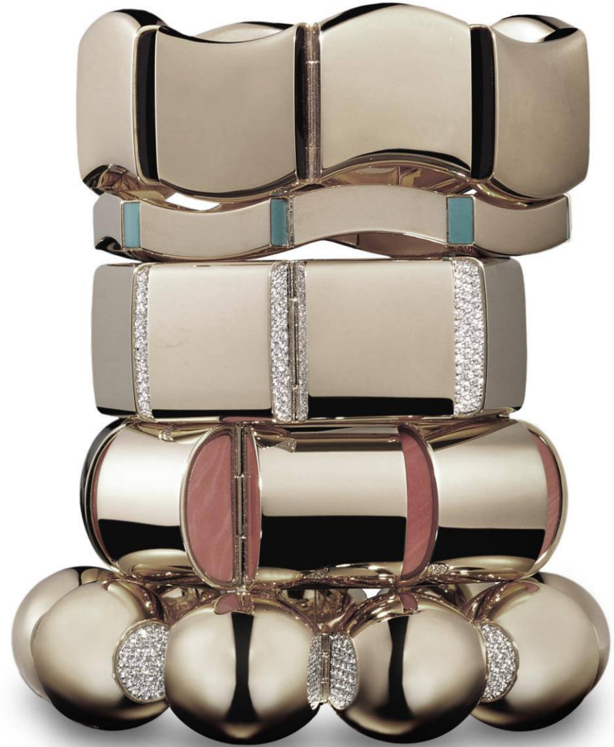
Até os dia de hoje, Vhernier